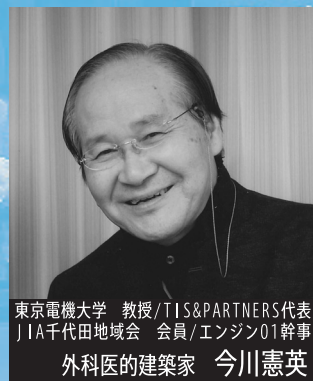
東京電機大学 教授/TIS&PARTNERS代表 JIA千代田地域会 会員/エンジン01幹事