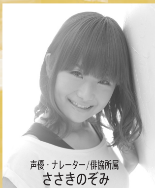
声優・ナレーター/俳協所属 ささきのぞみ